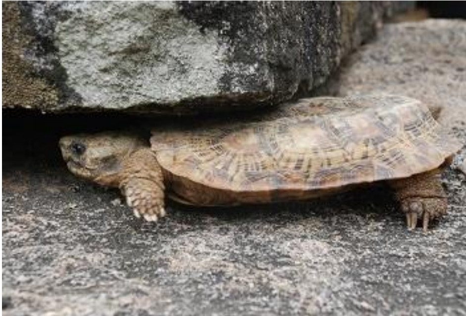
Spaltenschildkröte sucht Zuflucht in einer Spalte

(Loveridge & Williams, 1957). Insbesondere in der Trockenzeit, wenn die Tiere inaktiv sind, und ihre Spalte nicht verlassen, findet man auch größere Tieransammlungen in geeigneten Spalten.