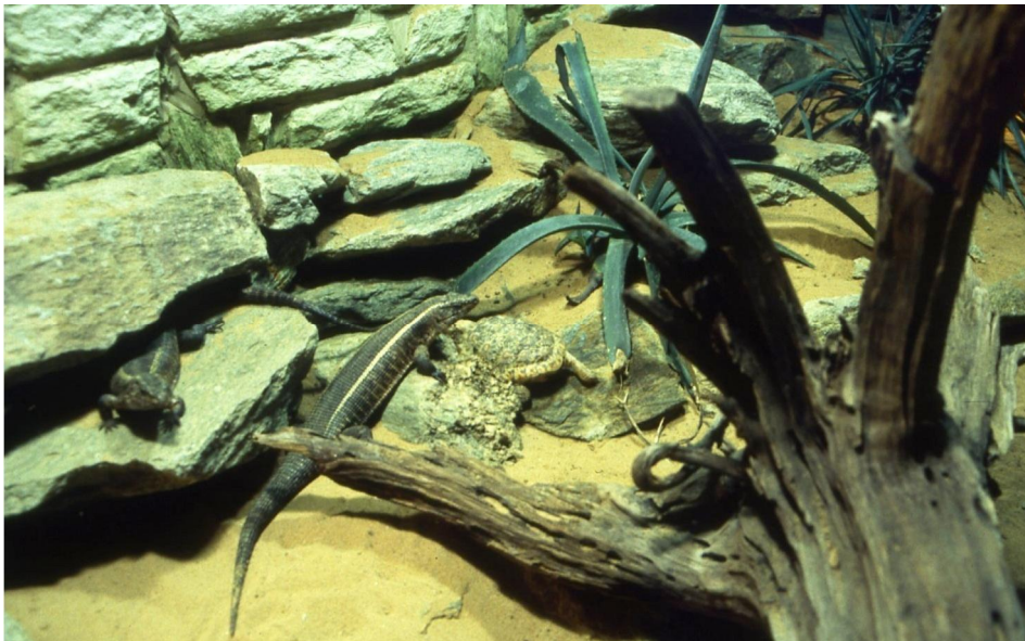
Beispiel eines Spaltenschildkrötenterrariums