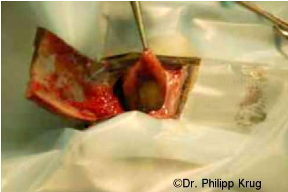
Die Harnblase ist eröffnet und der Stein ist sichtbar.