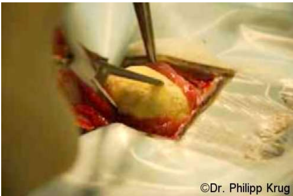
Mit einer Klemme wird der Stein vorsichtig gefasst und aus der Harnblase herausgezogen.